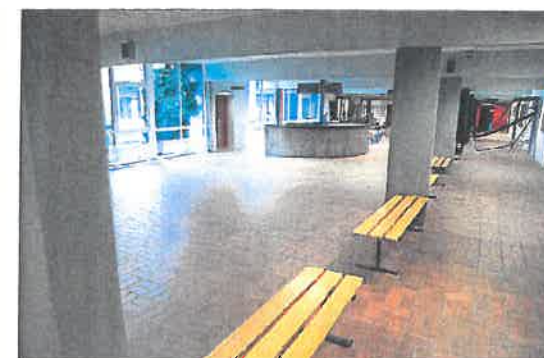
Thy Hallen er præget af store, men dårligt udnyttede områder.

Hele byggeriet ventes at være klar i 2021.