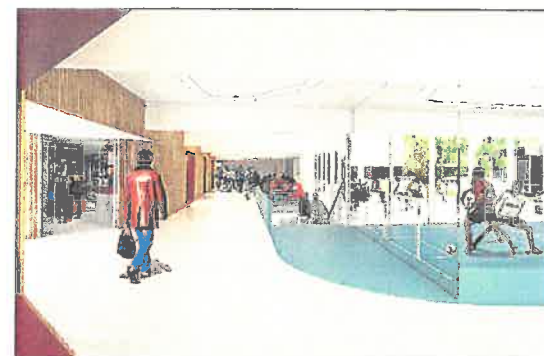
Med ombygningen vil faciliteterne blive åbnet op og gjort mere gennemsigtige. Illustration: Arkitektfirmaet Keigart